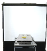
■ プロジェクター (スクリーン付き)