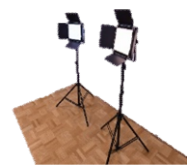
■ LED照明スタンドセット (2個組)