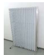
■ 移動式 簡易パーティション