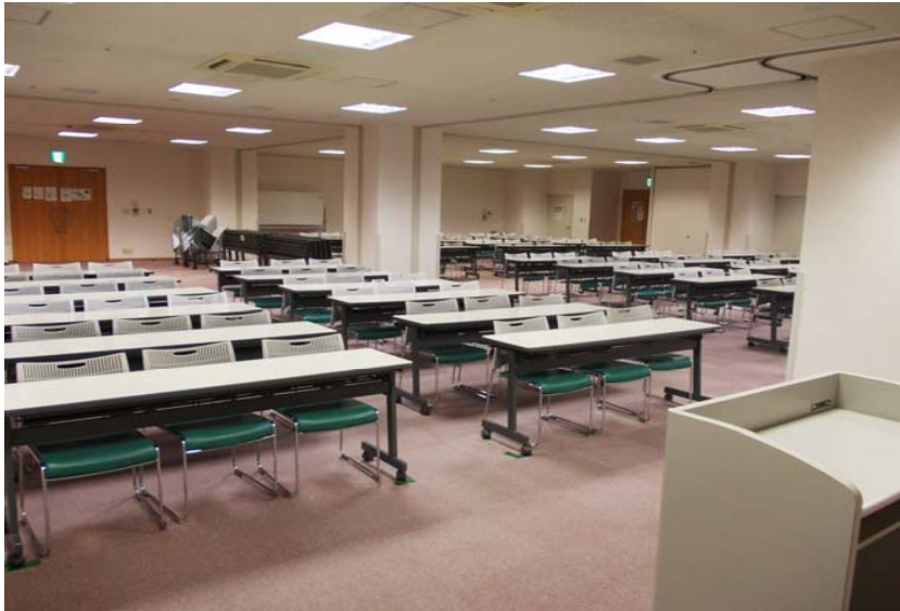
● 第3会議室 前方より