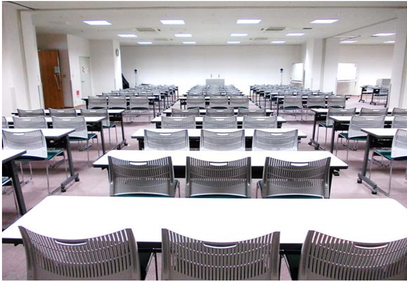
● 第1会議室 後方より ①