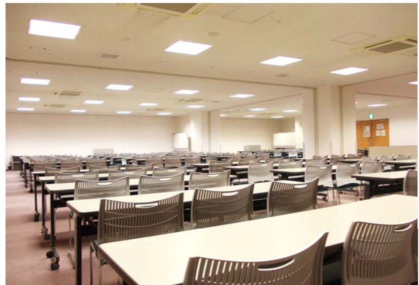
● 第1会議室 後方より ②